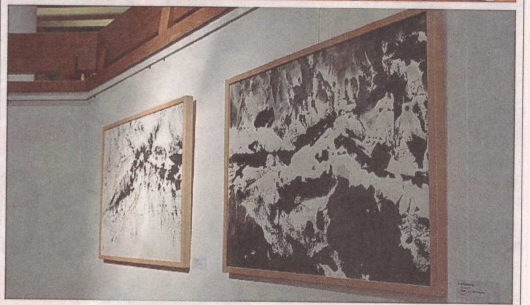
Traditionelle chinesische Malerei präsentiert Xiaoming Song aus Kassel.

Die Rathausgalerie Vellmar ist während der Sprechzeiten der Stadtverwaltung bis zum 12. April 2017 geöffnet.